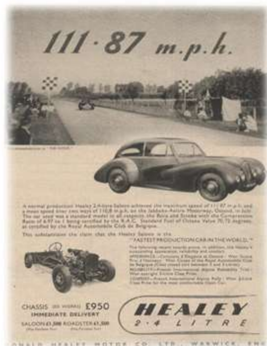
Boven en links: advertenties van Donald Healey Motorcompany uit 1946 en 1947. Donald

Healey sloot contracten met carrosserriebouwers die op basis van het Healey chassis interessante Healey's hebben gebouwd. Deze Healeys worden thans Warwick Healey's genoemd, naar de plaats waar de Healey fabriek stond in de jaren 40 en 50.