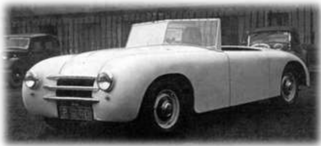
De allereerste Healey? Plaatje van een vroeg prototype van Healey direct na de 2 e wereldoorlog.