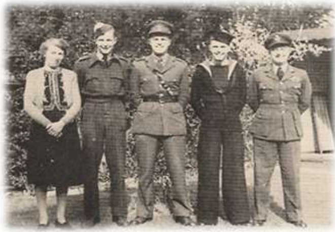
Familie portret uit 1944: Ivy John, Geoff, Brian en Donald Healey.